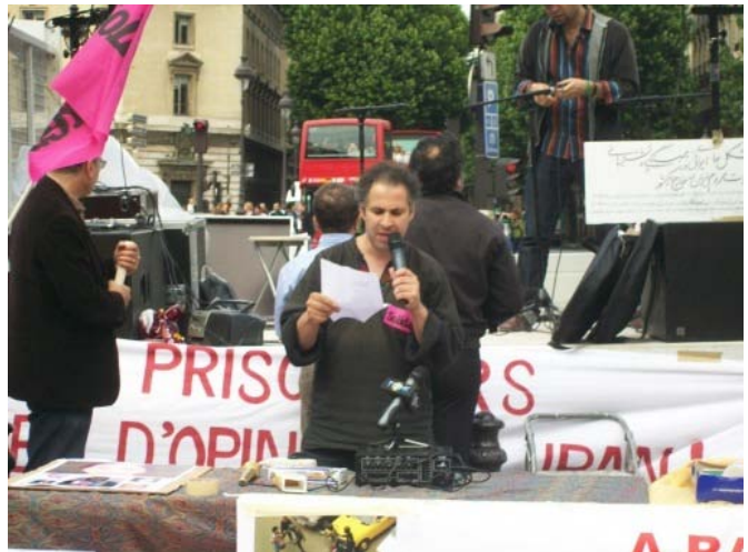
Intervention au nom de SUD Solidaires

Mobilisons-nous pour arrêter la machine de terreur du régime Iranien