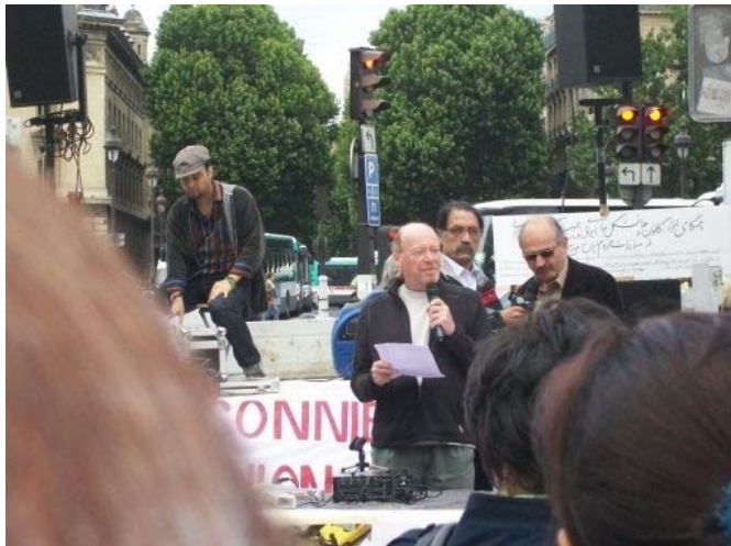
Intervention au nom de la CGT

Des délégations d'organisations françaises, comme le PCF, le NPA, la CGT ou SUD Solidaires sont intervenues pour affirmer leur solidarité avec la lutte du peuple d'Iran•