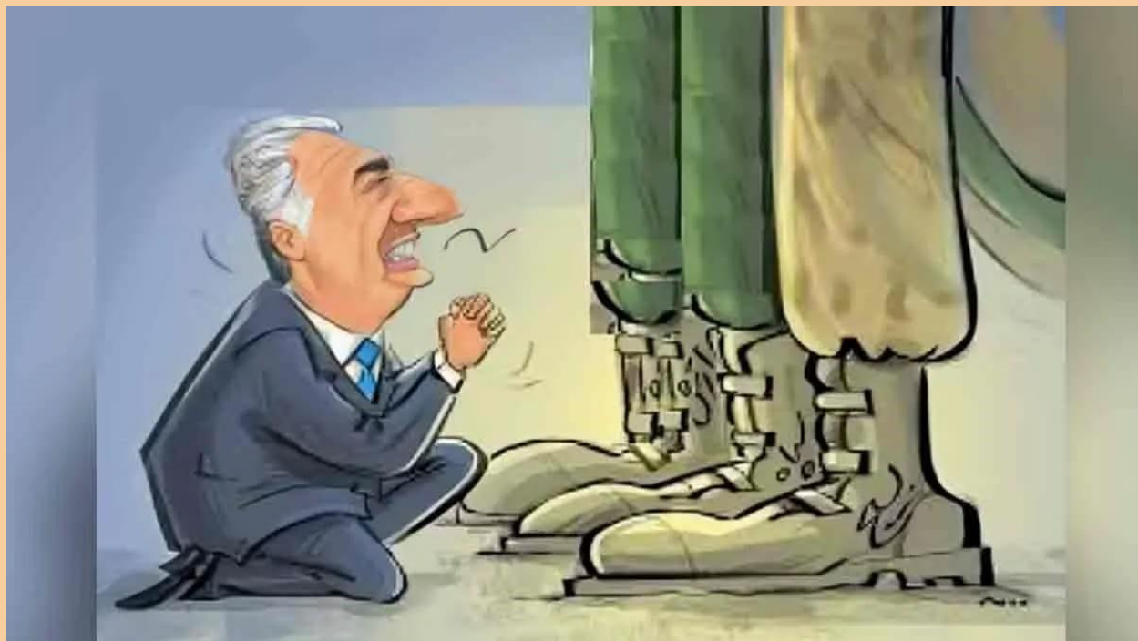
Reza Pahlavi en train de supplier Benjamin Netanyahu d'attaquer l'Iran »

Ces derniers mois, parallèlement aux informations concernant la guerre des États-Unis et d'Israël contre l'Iran, les grands médias occidentaux — y compris les chaînes de télévision françaises et la BBC britannique — ont largement évoqué, dans le cadre des spéculations sur la chute de la République islamique et son alternative possible, le nom de Reza Pahlavi , fils du Shah renversé lors de la révolution de 1979.