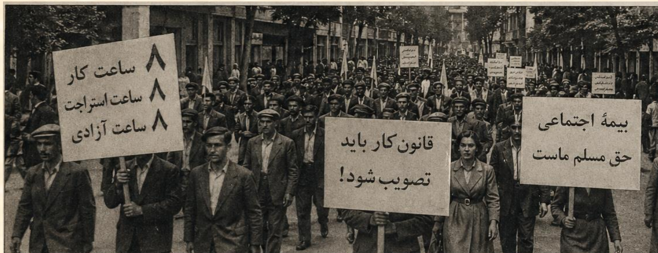
Manifestation du 1 er mai 1945 à Téhéran. Sur la pancarte, on peut lire : « Journée de travail de huit heures ! », « L'assurance sociale est un droit fondamental ! » - « Adoption du code du travail ! »

Dans le monde entier, le 1 er mai est associé à la mémoire de l'affaire de Haymarket et au sang versé par les travailleurs/euses pour la conquête de la journée de huit heures. En Iran, cette date s'enracine dans des luttes qui ont émergé dès le début du siècle dernier, parallèlement à l'essor de l'industrie moderne : imprimeries, chemins de fer, mines, puis raffineries et usines.