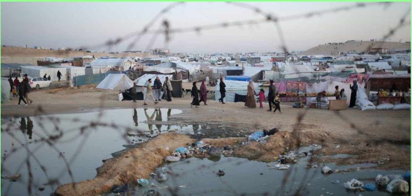
Des eaux usées et des déchets s'accumulent à proximité des tentes de personnes déplacées internes à Rafah, dans le sud de la bande de Gaza